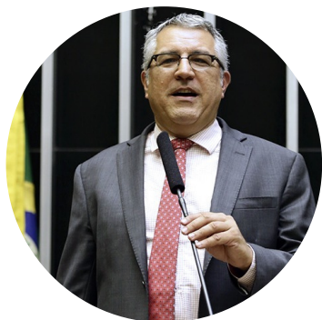
Dr. Alexandre Padilha