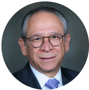
Dr. Francisco Becerra

A través de este panel, conoceremos los diversos sistemas de salud presentes en países de América Latina y el Caribe. Exploraremos las consideraciones que se emplean durante planificaciones sanitarias a pequeña y gran escala. Reconoceremos los proyectos y ejecuciones con mejores resultados, qué desafíos persisten y qué lecciones se pueden aprender de experiencias previas en diferentes países de la región. Daremos un mayor énfasis en la atención médica universal, ligada a la promoción de vidas saludables y prevención de enfermedades. También, sobre los prospectos para ampliar este sistema en la región, y los retos para incorporarlos en sistemas parcialmente privatizados. Este panel es una gran oportunidad para reconocer que los sistemas de salud deben alinearse a la diversidad de la población en la región y para garantizar un aprendizaje holístico, contamos con expertos en diversos sectores.