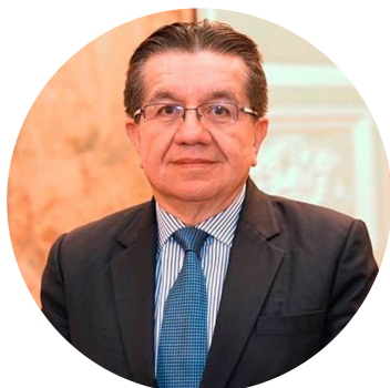
Dr. Fernando Ruiz Gómez

Este panel explorará los diferentes planes de inmunización en América Latina y el Caribe, buscando entender cuáles han dado los mejores resultados. Además, discutiremos qué podemos aprender de como los sistemas de inmunización existentes han impactado la actual vacunación contra la Covid-19. Por último, analizaremos qué pueden aprender los países de la región de la actual campaña de vacunación para mejorar la política actuales, e implementar cambios en futuras estrategias de inmunización pospandemia.